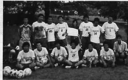
ベスト4のサッカーサークル