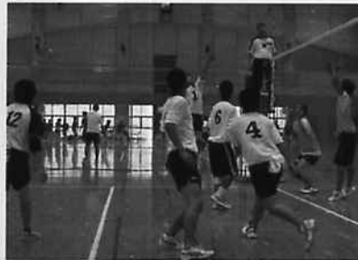
ベスト4に輝いた男子バレー