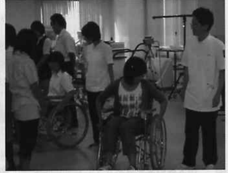
車椅子を使った体験授業