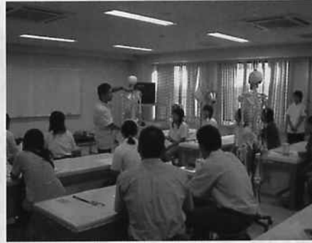
人体模型を使っでの授業