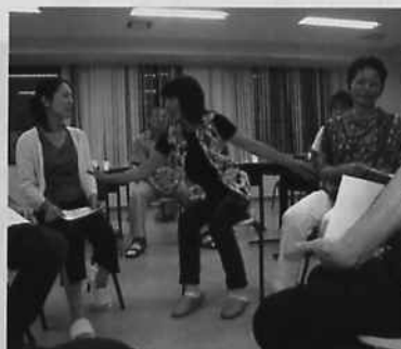
真剣な専攻科学生さん達