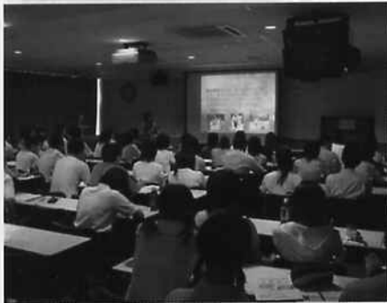
プロジェクターを使った学科紹介

7/27・8/17・27の3日間、学校説明会が開催されました。今年は、たくさんの方々へ本校を知って貰えるよう回数を2回から3回に増やし本校の概要説明・入試案内・校内見学・各学科の体験授業・病院見学が行われ、体験授業などは参加者の皆さんから「どんな授業をするのか理解できた」「とても話が面白く分かりやすかった」など大変好評でした。今後も毎月の学校見学会(9/10・10/8・11/12・12/10)、作業療法学科の体験授業(8/23・9/20・10/18・11/22・12/20)を行います。