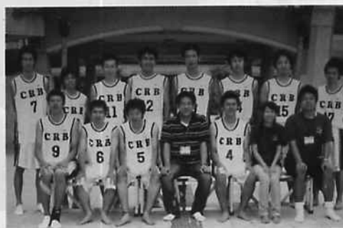
大活躍の男子バスケットボールサークル

終クォーターに入り、最後の力を振り絞って戦いましたが、善戦むなしく85対97で敗れてしまいました。 結局決勝トーナメント1回戦負け、全国ベスト8という結果でした。しかし、この夏、沖縄で選手達は貴重な体験・思い出をつくる事ができました。選手の方々が頑張りました。