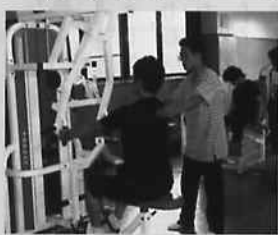
本校体育館で行われた講習会

会場になった本校体育館にはメーカー協力の16台のウエイトトレーニングマシンが並び、高齢者用に設定された規格で取り扱いやトレーニング方法など細部にわたった研修プログラムが展開されました。