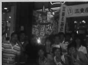
貴重な体験をした学生達

この理学療法士による甲子園でのメデイカルサポート活動は今年で10年になります。障害予防のために試合後に理学療法士が投手の肩の可動域を測定したり、選手のアイシングやストレッチングといったクーリングダウンを指導しています。テレビの向こう側の世界。選手にとって長い野球人生への下支えとして、夢を持つ学生がいくつか活動してくることを願っています。