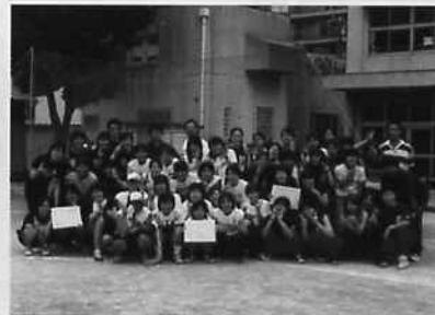
2年連続優勝のソフトボール